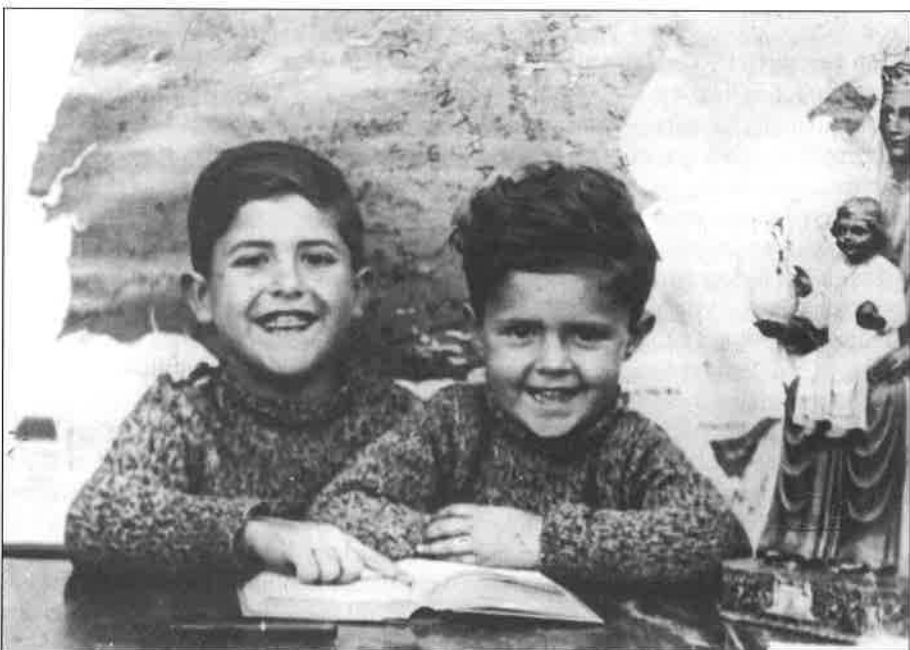
Dos germans alumnes de les escoles parroquials als anys quaranta

Les escoles parroquials del Guinardó van ser creades per mossèn Eugeni Florí, fundador de la parròquia